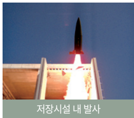
저장시설 내 발사